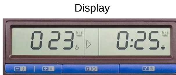
Tasten zum Einstellen

Lasst Euch von mir in der WhatsApp-Gruppe SG Duisburg-Nord registrieren!